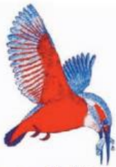
v.z.w. De Mark

5 Tibetaanse oefeningen voor een vitaliserende werking op lichamelijke en mentale conditie. Verder activatie van ademhaling, buikspieren, rug en